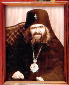
святителя Иоанна Шанхайского и Сан-Францисского